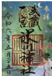
特別紙朱印 螢 5/25〜