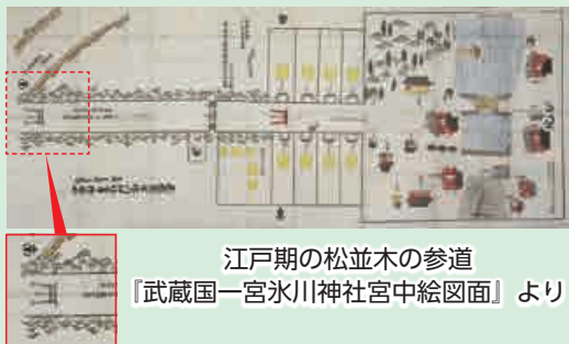
江戸期の松並木の参道 『武蔵国一宮氷川神社宮中絵図面』より