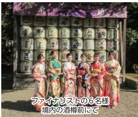
ファイナリストの6名様 境内の酒樽前にて