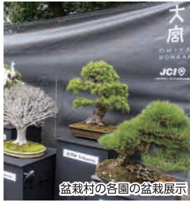
盆栽村の各園の盆栽展示