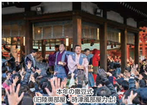
本年の撒豆式 (旧陸奥部屋・時津風部屋力士)

当社では、午前九時から節分祭が行われ、祭典中には弓の弦を鳴らして災厄を祓う鳴弦の儀が行われました。その後、神職二名により「福は内、福は内、鬼は外」の掛け声とともに舞殿より福豆が撒かれました。