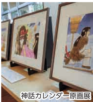
神話カレンダー原画展