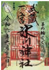
特別紙朱印 茅の輪くぐり 6/22〜