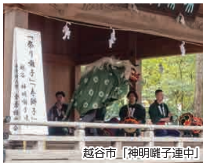
越谷市「神明囃子連中」