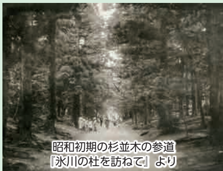
昭和初期の杉並木の参道 『氷川の杜を訪ねて』より